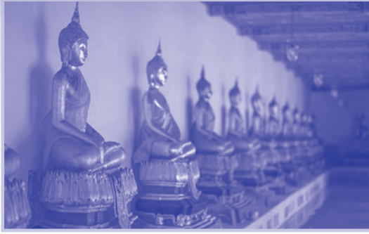
๔. พระพุทธรูปปูนปั้นปิดทอง ปางมารวิชัย หน้าตักกว้าง ๑ เมตร จำนวน ๘๐ องค์ ประดิษฐานอยู่รอบพระระเบียง