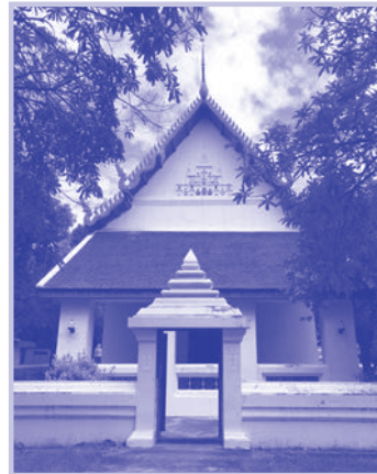
๒. พระวิหาร มีพะไลด้านหน้าและด้านหลัง กว้าง ๘ เมตร ยาว ๒๐ เมตร เดิมเป็นพระอุโบสถ สมเด็จพระเจ้าบรมวงศ์เธอ เจ้าฟ้าประไพวดี กรมหลวงเทพยวดี ทรงเห็นว่าคับแคบ จึงทรงบูรณะให้เป็นพระวิหาร และทรงสร้างพระอุโบสถขึ้นใหม่