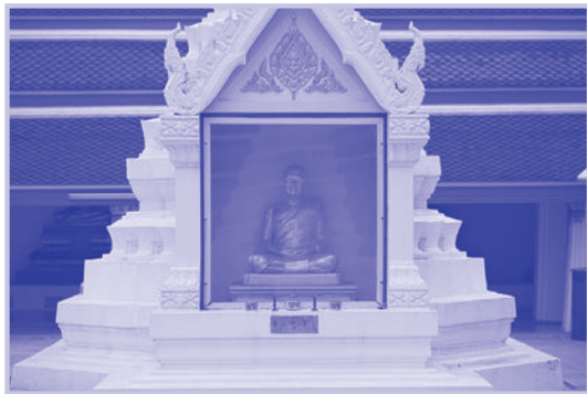
๖. รูปเหมือนพระธรรมถาวร (ซ่ง สงกัจโจ) ขนาดใกล้เคียงองค์จริงหล่อด้วยทองเหลือง หล่อเสร็จเมื่อปลาย พ.ศ. ๒๕๒๔