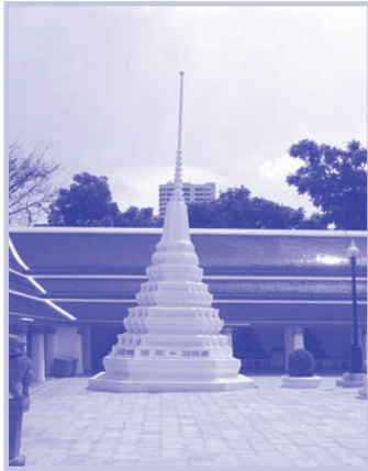
๕. พระเจดีย์ย่อมุมไม้สิบสอง อยู่ที่มุมทั้งสี่ของพระอุโบสถ มุมละ ๑ องค์ และพระเจดีย์ทรงระฆังอยู่ที่มุม ๔ มุมพระวิหาร มุมละ ๑ องค์ องค์ที่อยู่มุมขวาด้านหลังพระวิหารเป็นของเก่า ส่วนอีก ๓ องค์ ซ่อมแซมใหม่